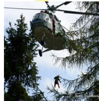
vykonáva záchranu osôb ohrozených požiarom