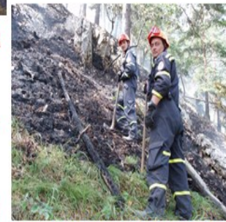
podieľa sa na likvidácii ohnísk

Fyzická osoba je povinná: dodržiavať vyznačené zákazy a plniť príkazy a pokyny týkajúce sa ochrany pred požiarmi, dodržiavať zásady protipožiarnej bezpečnosti pri činnostiach spojených so zvýšeným nebezpečenstvom vzniku požiaru alebo v čase zvýšeného nebezpečenstva vzniku požiaru, oznámiť bez zbytočného odkladu príslušnému okresnému riaditeľstvu hasičského a záchranného zboru požiar, ktorý vznikol v objektoch, priestoroch alebo na veciach v jej vlastníctve, zabezpečovať pravidelné čistenie a kontrolu komínov, dodržiavať pri manipulácii s horľavými látkami a horenie podporujúcimi látkami požiadavky na protipožiarnu bezpečnosť, umožniť orgánom štátneho požiarneho dozoru vykonávanie potrebných úkonov pri zisťovaní príčin vzniku požiarov, zabezpečovať plnenie opatrení v súvislosti s ochranou lesov pred požiarmi.