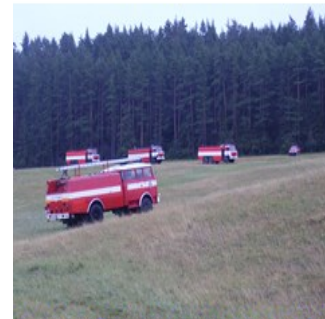
zabezpečuje dostatok hasiacej látky